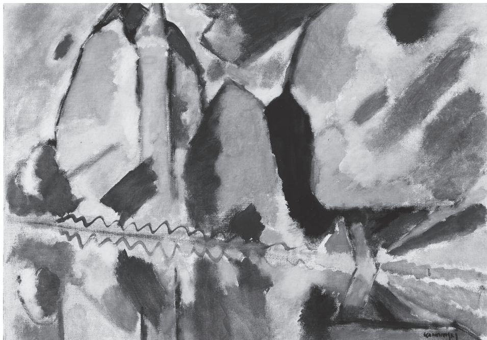
Wassily Kandinsky (1866–1944), Tardor II, 1912. The Phillips Collection, Washington, D.C.